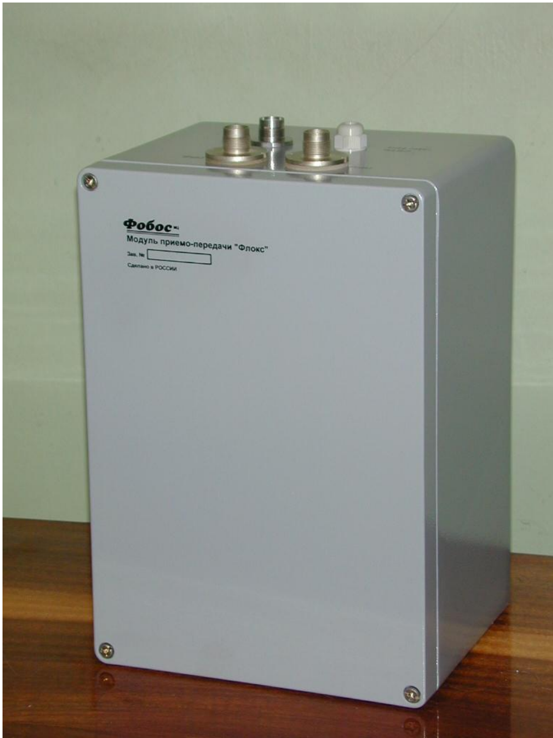
Внешний вид БПП «Флокс» (Ваш экземпляр может отличаться)